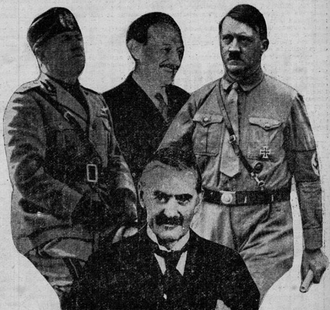
BENITO MUSSOLINI, Italia; EDUARDO DALADIER, Francia; ADOLFO HITLER, Alemania, y NEVILLE CHAMBERLAIN, Gran Bretaña, quienes se reunirán hoy en Munich, capital de Baviera, para tratar de darle solución al amenazante complejo europeo.