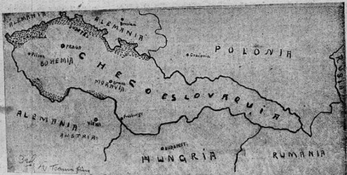
La delicada situación de Checoslovaquia queda evidenciada con la contemplación de este mapa que muestra la situación de la nación checa rodeada de enemigos o de naciones hostiles por todas partes salvo en el pequeño trazo que la separa de Rumania en el ángulo suroccidental del país: Polonia, Alemania y Hungría la rodea a casi totalmente. Sobre las líneas fronterizas con Alemania las partes punteadas indican las regiones ocupadas por sudetinos que son las que reclaman los alemanes.