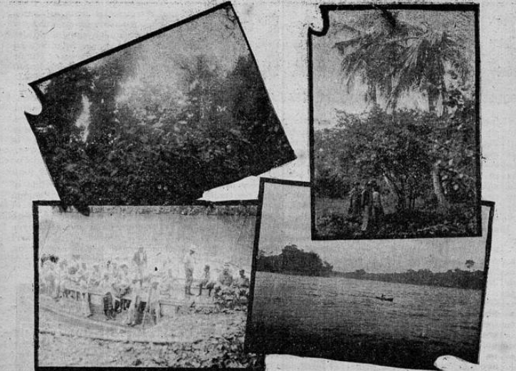
La lujuriosa vegetación en la región de Sixaola; Un grupo de excursionistas detiene la marcha para descansar al pie de las palmeras legendarias. Tras de remontar el río Sixaola, los diputados y demás miembros de la expedición se disponen a saltar a tierra. Una hermosa vista panorámica del gran río Sixaola, que el gobierno del Presidente Cortés se empeña en ceder a Panamá.

Y seguimos. Ahora hemos de jado la embarcación. Yo camí no un poco alejado del grupo. He rido las filas. Risas y charrazos Chistes a granal. Siguen. Yo sigo por otro rumbo. Me interesan los helechos gigantescos. Los rabo de mico que nunca viera más espléndidos y lozanos. Se hacen trenzas entre el ramaje, pero logran sobresalir con su presencia y con su vigor. Caña brava. Especie de bambú raro veo más adentro. Tallos rojizos; lianas; corimbos, begonias, musros... y sin embargo, no encuentro los fanzales ni los cuampios que decían los entreguistas. Esta tierra es privilegiada. Ranchos que se alzan aquí y allá.